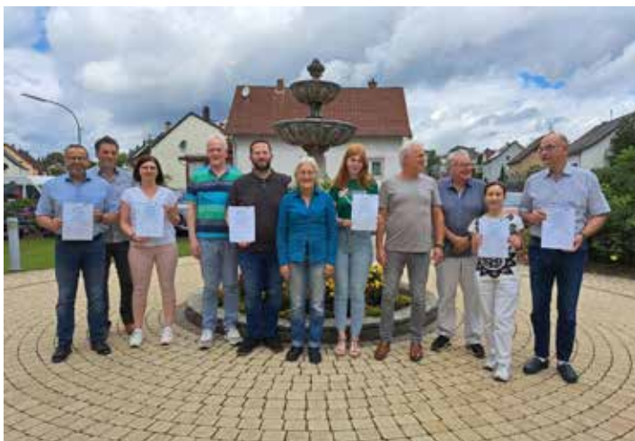
Auszeichnung durch die Bundesregierung– Urkundenübergabe an Netzwerkteilnehmer beim 4. Netzwerktreffen

Energieeffizienz- und Klimaschutz-Netzwerke